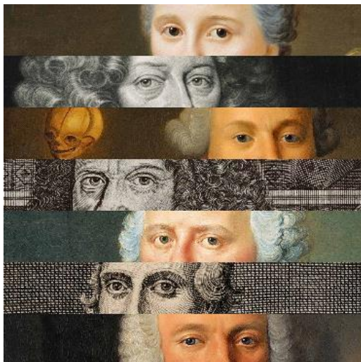
Bildnachweis: Ausschnitte aus ausgestellten Werken

Die Ausstellung zeigt Meisterwerke der Porträtkunst, die dem Patriziat der Stadt wie der Familie Holzhausen und der gebildeten Oberschicht wie dem Arzt und Naturforscher Johann Christian Senckenberg zur Repräsentation dienten. Zu sehen sind neben Gemälden druckgraphische Porträts, die vor der Erfindung der Fotografie die einzige Möglichkeit zur Vervielfältigung und Verbreitung lieferten. Der Ausstellungsrundgang spiegelt mit einer abwechslungsreichen Auswahl von 42 Gemälden und 105 Druckgraphiken die soziale Ordnung der ständisch organisierten Gesellschaft Frankfurts vom 16. bis zum 18. Jahrhundert wider.